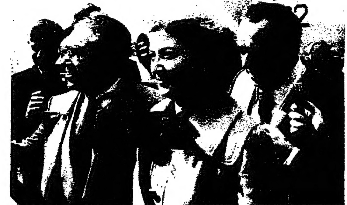
الدكتور يوسف هداس ، وزير اسرائيل المفوض في السفارة الاسرائيلية في القاهرة لدى وصوله الى مطار القاهرة بصحبة زوجته واطرافه .

القاهرة - يحتفل في الساعة العاشرة من صباح اليوم برفع العلم الاسرائيلي على مبنى السفارة الاسرائيلية في القاهرة ، وسيقوم برفع العلم ، الوزير المفوض في السفارة ، الدكتور يوسف هداس ، الذي غادر البلاد صباح امس الى القاهرة على رأس وفد . وصرح الدكتور هداس قبيل مغادرته مطار بن غوريون انه مما لا شك فيه ان اللحظة التي سيتم فيها رفع العلم الاسرائيلي فوق مبنى السفارة في عاصمة اكبر دولة عربية ، ستكون لحظة مؤثرة .